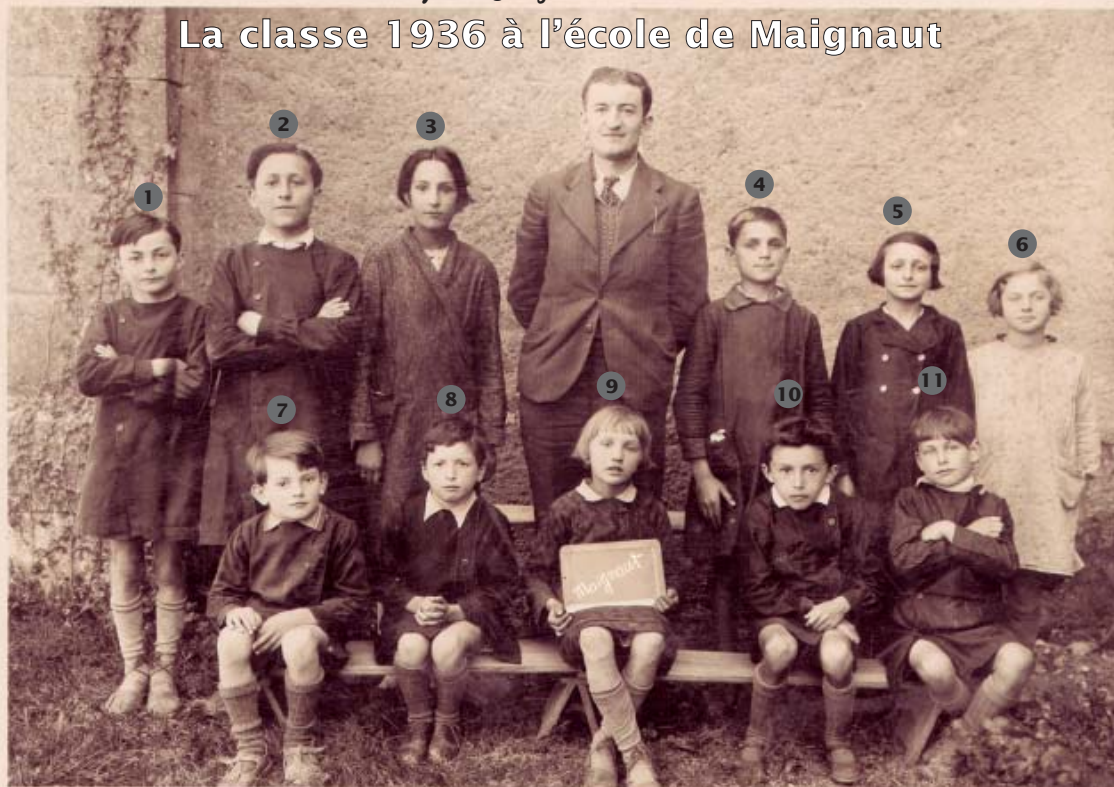
Vous reconnaissez-vous ?... Les reconnaissez-vous ?...

Association Mignaut-Passion - Siège social : Au village - 32310 Mignaut -Tauzia